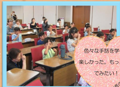
手話（対象：小学1～6年生）