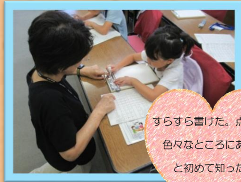
点字（対象：小学1～6年生）