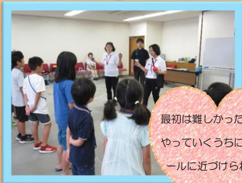
ボッチャ（対象：小学1～3年生）