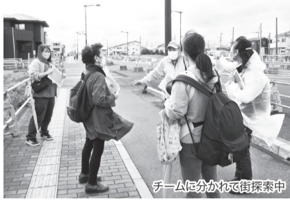
チームに分かれて街探索中

また、令和8年4月には、「お試しウォーキング〜あるといい情報探し〜」に20名が参加しました。活動後の報告会では「目的をもって歩くと普段気づかない、発見があった」「回数を重ねるといけば充実したものになる」など、地域資源の発掘や不足している部分を考える機会となりました。このように、地区内の皆様の協力により、地域をよりよくする取組みを検討しています。興味のある方はぜひ参加ください。