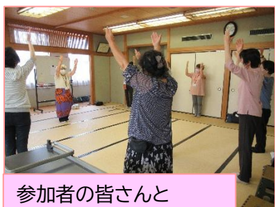
参加者の皆さんと体操を体験しました！

令和7年5月21日（水） 北越谷地区の通いの場を周知することを目的としたイベント第3回「家を出て、会おう！話そう！笑い合おう！」を実施！！